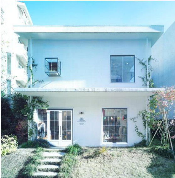
代官山コッカ（実店舗）